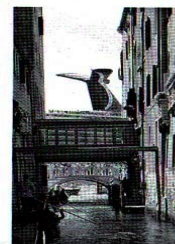
Un mastodonte in bacino

rive e dei fondali? Nel nuovo Dvd «Venezia e le Grandi navi» viene documentato con foto e filmati cosa succede quando una meganave da crociera arriva a San Marco. Una presenza davvero fuori scala, con i cammini fumanti più alti dei campanili e poi le scie ben visibili dall'alto dei sedimenti sollevati e dell'erosione provocata da eliche e spostamenti d'acqua. Infine, i fumi «Bisogna imporre alle navi di ogni dimensione», dice Mazzolin, «l'uso di combustibili meno inquinanti quando entrano in laguna, e i generatori devono stare spenti quando le navi sono attraccate». Una battaglia, questa, da anni sostenuta anche dall'ex comandante dei piloti del porto Ferruccio Falconi. «Per ridurre i fumi», dice, «si possono alimentare da terra, così possono tenere i motori spenti. I sistemi esistono, basta applicarli». (a.e.)